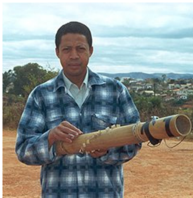
Un joueur de valiha (un valihiste)