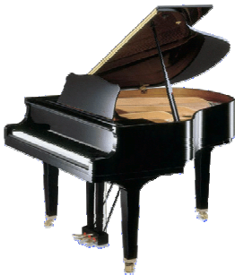
2 pianos (cordes frappées)